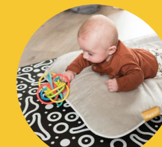
Ležení na břiše s oporou