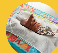
Ležení na boku