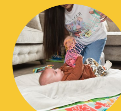
Ležení na zádech

Usnadňuje klíčové terapeutické pozice pro včasnou intervenci.